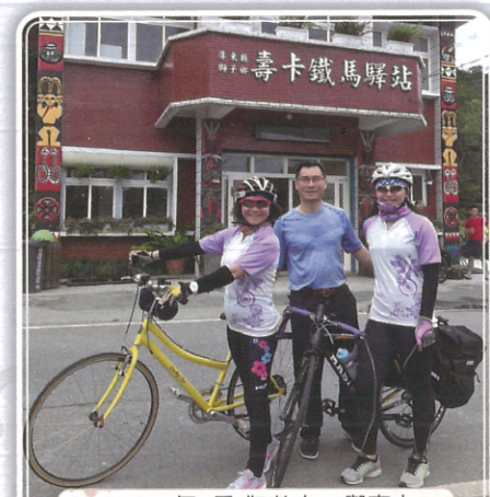
2017年4月 作者(左1)與家人合影於屏東壽卡鐵馬驛站

里，深夜趕到苗栗，下榻後龍；自從國中畢業後，40 年沒好好騎鐵馬了，那一夜，臀部腿部痠痛僵硬，至今難忘。