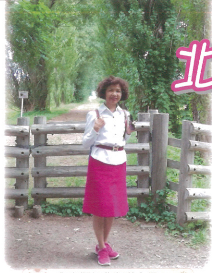
作者攝於北海道大學

當職場生涯告一段落，著手規劃後半場人生旅程之際，進修學習的念頭油然而生，因此，我選擇回歸學生身份，重拾書本進入學堂研習畢生最感興趣的日語，對我而言也是這後半場人生中一件很重要的事。