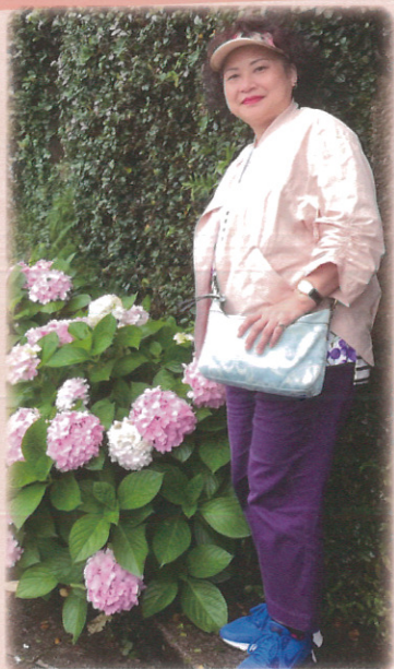
作者攝於馬祖芹壁村

◇發行人 / 大直高中 溫馨父母成長班 ◇地址 / 台北市北安路420號 電話：2533-4017 #152 主編：陳玫吟 ◇成長班網址 www.dcsb.tp.edu.tw/ 首頁/團體與組織/溫馨父母班 ◇版面設計 / 嘉群印刷事業有限公司 電話：(02)2799-5667